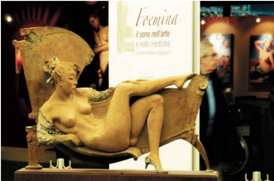
La mostra Foemina, il seno nell'arte e nella medicina